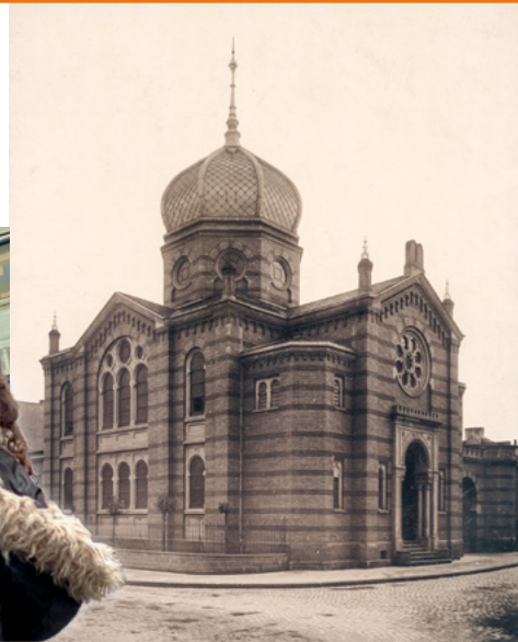
Die Synagoge in St. Johann (Saar), 1892